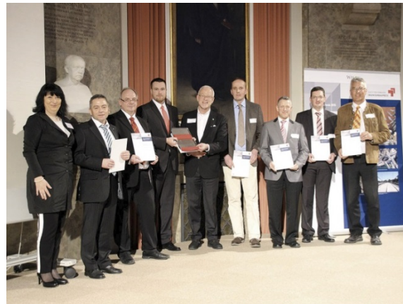
Das Projektteam „Saarbrücke Mettlach“