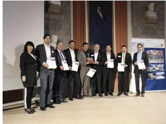
Das Projektteam „Eisenbahnüberführung Grubenthalbrücke“