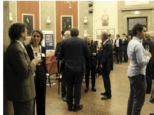
Angeregte Gespräche beim Sektempfang im Anschluss an die Preisverleihung.