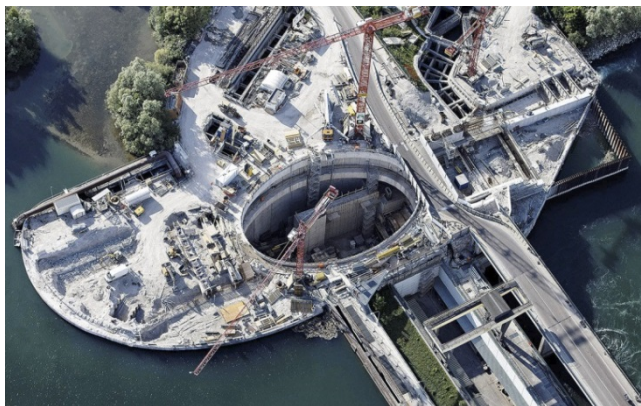
Das Projekt Baugruben zur Erweiterung des Rheinkraftwerks Iffezheim erhielt eine Auszeichnung