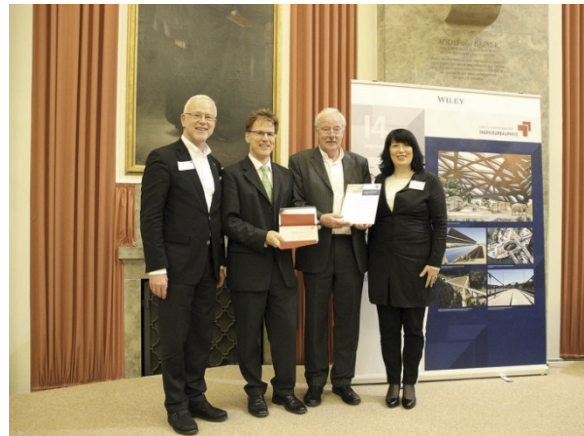
Das Projektteam „Ultimate Trough Test Loop, Kalifornien“