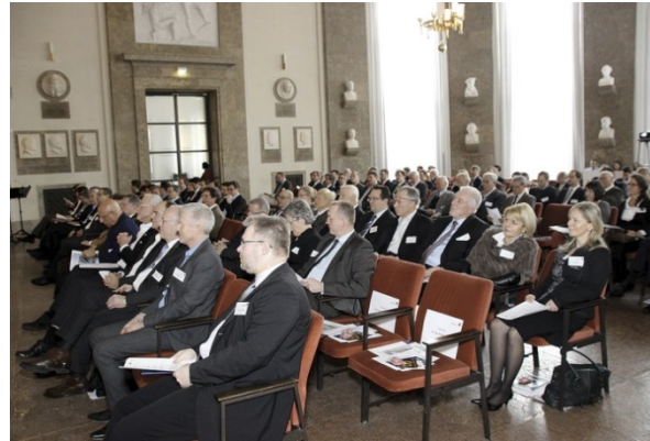
Publikum im Ehrensaal des Deutschen Museums