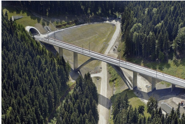
Das Projekt Eisenbahnüberführung Grubenthalbrücke, Goldisthal im Thüringer Wald, erhielt eine Auszeichnung