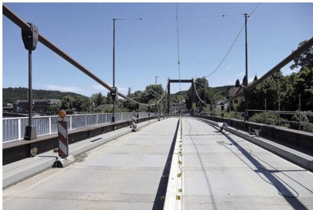
Das Projekt Sanierung und Instandsetzung der Saarbrücke Mettlach erhielt eine Auszeichnung