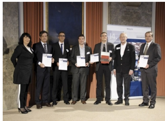
Das Projektteam „Baugruben zur Erweiterung des Rheinkraftwerks Iffezheim“