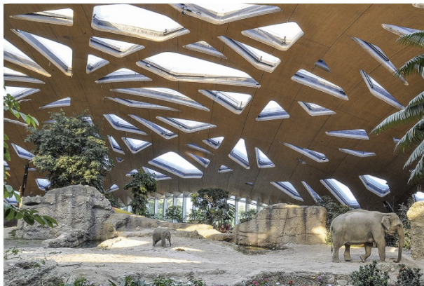
Der Preisträger: Kaeng Krachan Elefantentpark, Zoo Zürich