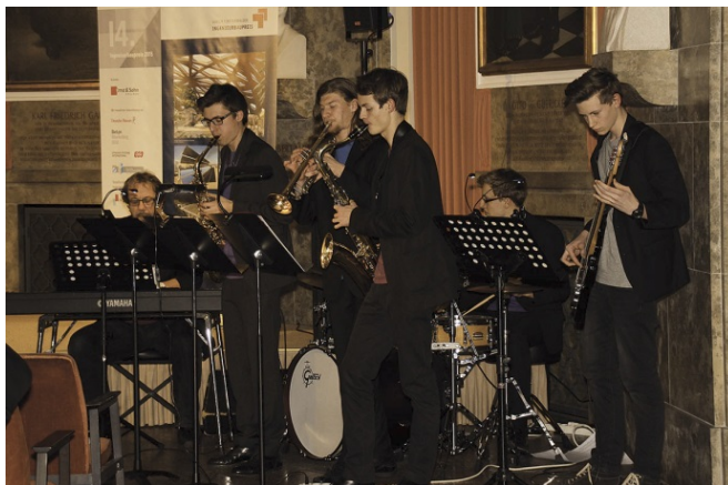
Die LOZZI Jazz Combo umrahmt die Preisverleihung musikalisch.