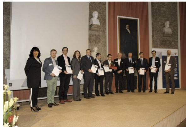
Ehrung des Projektteams „Kaeng Krachan Elefantentpark, Zoo Zürich“