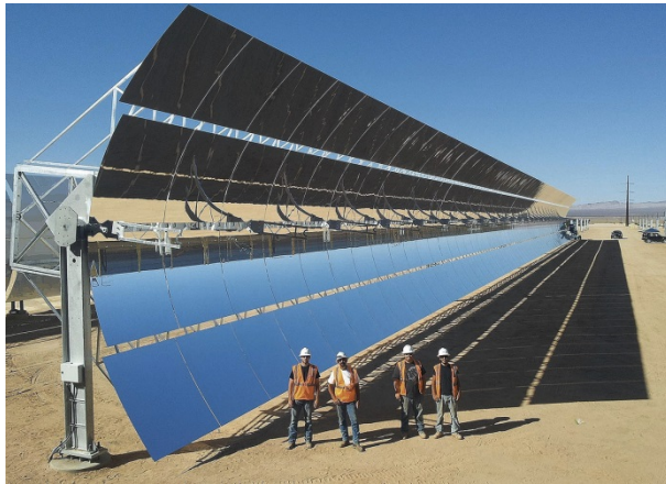
Das Projekt Ultimate Trough Test Loop in Kalifornien erhielt eine Auszeichnung